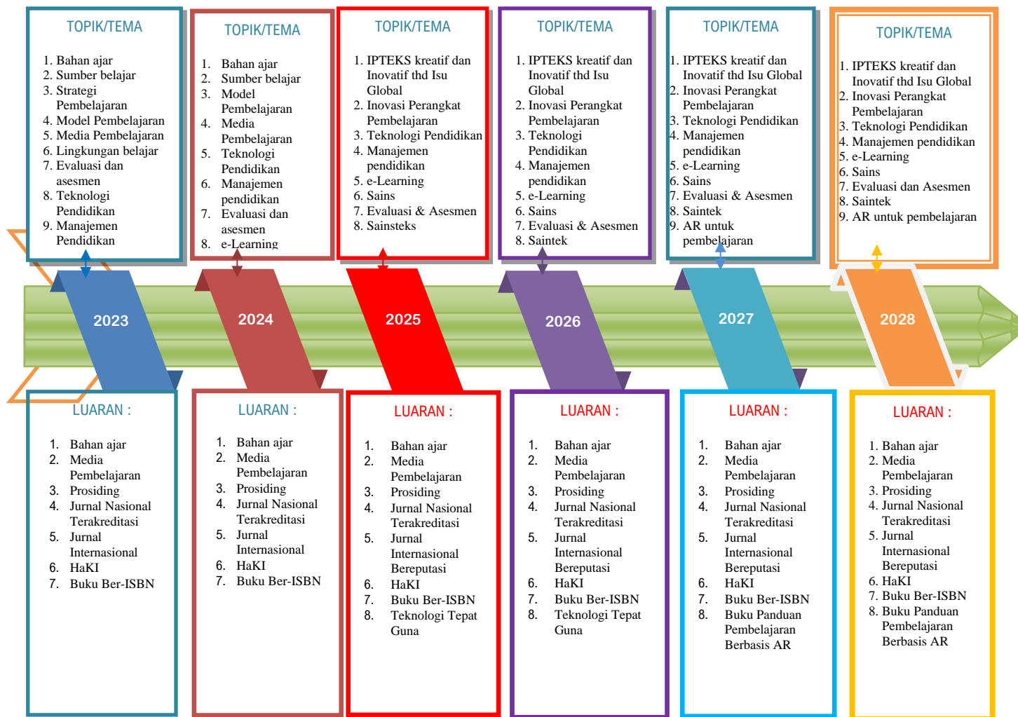
Gambar 2. Roadmap Penelitian Program Pascasarjana